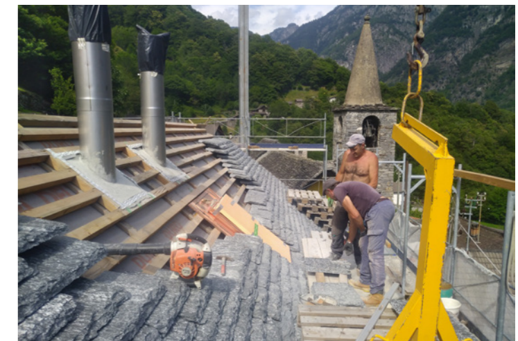
Couvriers lors de la pose des pierres plates sur le toit

Le but de ce projet était de rénover dans le bâtiment deux appartements destinés à être loués à deux nouvelles familles souhaitant s'installer à Menzonio.