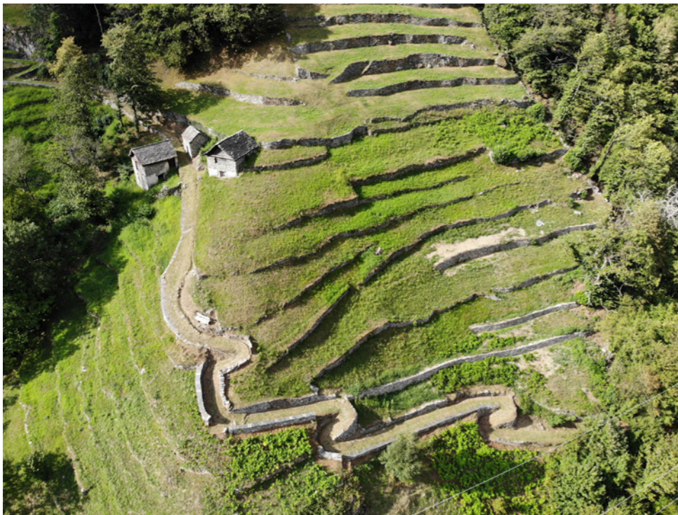
Murs en pierres sèches dans le secteur de «Coste»

En conclusion, malgré les conditions difficiles, nous sommes satisfaits de ce que nous avons réalisé cette année. Néanmoins, nous espérons que l'année prochaine, le déroulement des interventions sera plus facile et que nous pourrons revenir à une situation quasi normale.