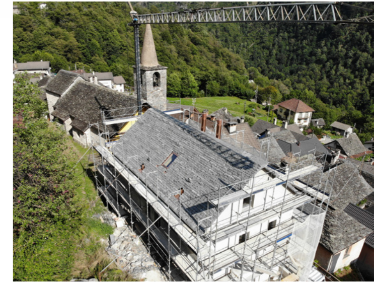
Réfection du toit en pierres plates de la maison paroissiale de Menzonio

Néanmoins, nous avons progressé dans la rénovation de la maison paroissiale de Menzonio - mais pas exactement dans les délais prévus.