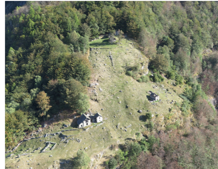
Récupération d'une surface agricole dans le secteur de «Coste»

activités, nous entretenons également une grande partie des sentiers de notre territoire, même si cette intervention relève du domaine de compétence de l'Office du tourisme. Cependant, le réseau de sentiers dans la vallée de la Maggia est si étendu que l'Office du tourisme ne peut à lui seul réussir à entretenir tous les sentiers. C'est pourquoi nous nous occupons, afin que les visiteurs - et les habitants - puissent découvrir notre paysage de montagne en toute sécurité.