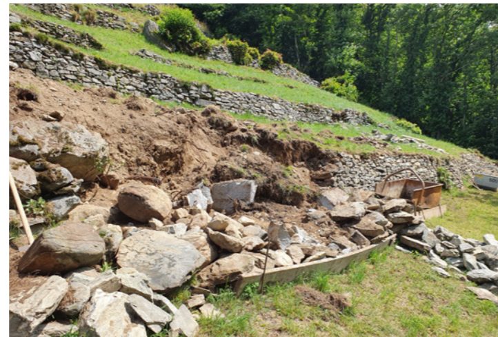
Reconstruction des murs en pierres sèches dans le secteur de «Coste»

Au risque de nous répéter, nous voudrions souligner une fois de plus l'importance des travaux d'entretien effectués au cours de l'année par deux entreprises locales. Vous trouverez ci-dessous un bref résumé des mesures prises, qui vise à vous montrer combien il est important pour nous d'entretenir ce qui a déjà été réalisé. L'une des premières interventions consiste à remettre en état le sentier didactique afin qu'il puisse être utilisé aisément par les visiteurs et leur permette de découvrir Brontallo et de voir ce que nous avons déjà réalisé.