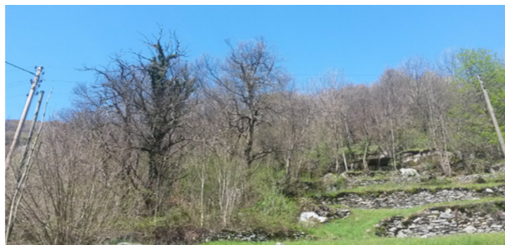
La forêt a beaucoup poussé, surtout dans la partie haute

En quelques mots, le projet concerne une forêt située à environ 700 mètres d'altitude, au lieu-dit «Pianelli» à Brontallo, à proximité du village de Menzonio.