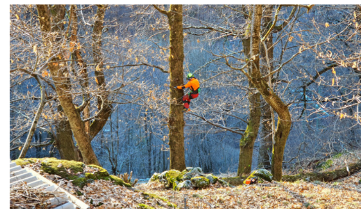
Préparation de la coupe de l'arbre en toute sécurité

Il a été décidé de commencer par la partie basse et de continuer aussi longtemps que la pause végétative le permettra.