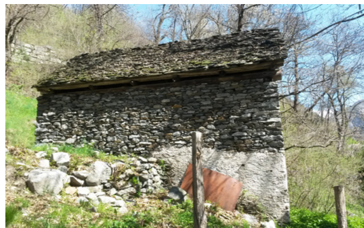
Restauration d'une étable

La zone concernée par le projet comporte plusieurs secteurs intéressants d'un point de vue écologique et paysager. Pour cette raison, les interventions prévues portent notamment sur la reconstruction des murs de pierres sèches, la création de passages entre les différentes terrasses, la remise en état d'un ancien sentier et d'autres constructions qui méritent d'être préservées (amélioration de bâtiments et petits ouvrages).