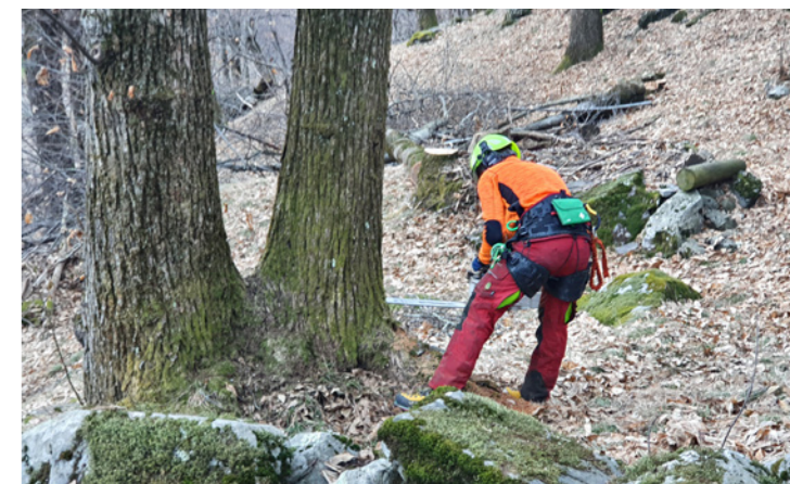
Premières opérations de coupe

Nous avons le plaisir de vous annoncer que le projet a officiellement débuté à la fin-février. Les arbres à couper ont été marqués, après quoi une entreprise forestière a commencé les premières opérations de coupe.