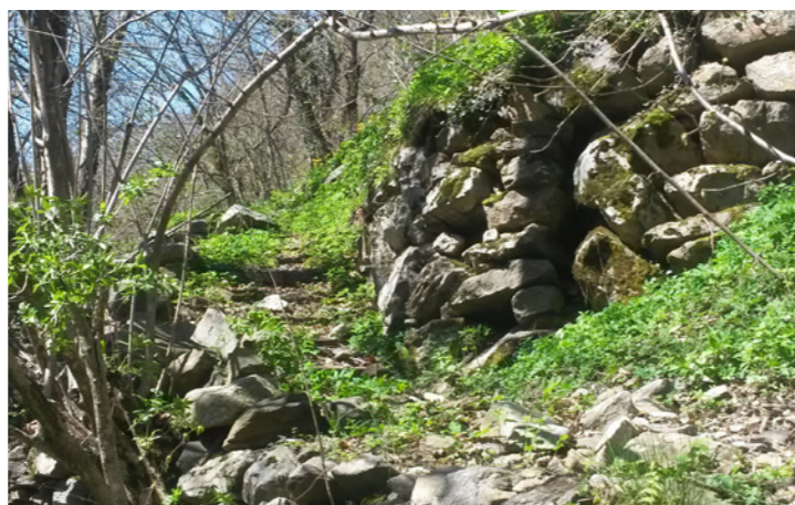
Remise en état d'un ancien sentier

Une bonne partie des châtaigniers présents dans la forêt sont disposés en îlot entre les différentes zones en terrasses exploitées pour le fauchage. La plupart de ces arbres sont heureusement encore en bonne santé. À l'issue des travaux de réhabilitation de la châtaigneraie, cette zone pourra être exploitée en pâturage extensif.