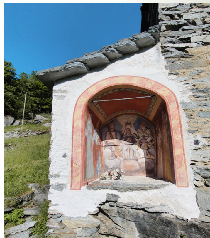
La «Capéla du Pignàta», restaurée en 2005.

La zone concernée par ce projet est située à Margoneggia, zone à environ 900 m d'altitude et accessible à pied depuis Brontallo en une trentaine de minutes. Margoneggia est la montagne la plus basse et la plus proche de Brontallo. Les bâtiments qui s'y trouvent sont répartis en deux groupes, Margoneggia di Dentro et Margoneggia di Fuori. Ce dernier noyau, où se trouve également une petite église consacrée à Saint Antoine, est le plus grand des deux. Les terrains qui l'entourent, orientés essentiellement vers la vallée, sont en partie assez plats avec quelques terrasses et majoritairement exploités comme prairies de fauche.