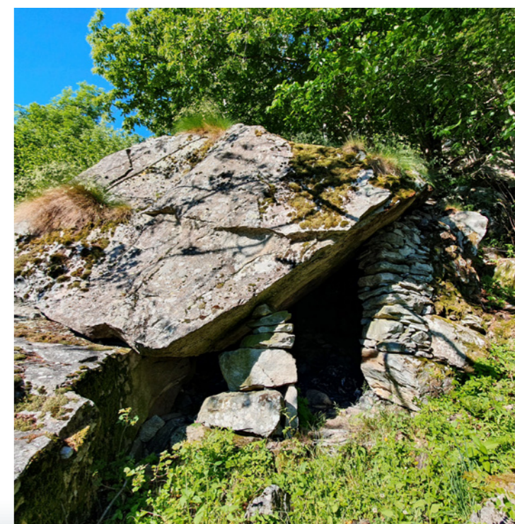
«Splüi» (refuges naturels sous la roche)

L'objectif principal du projet est de réhabiliter et de mettre en valeur ce paysage en terrasses particulier (environ 1500 mètres linéaires de murs de pierres sèches dans la zone concernée) ainsi que de créer les conditions pour assurer demain aussi son exploitation agricole.