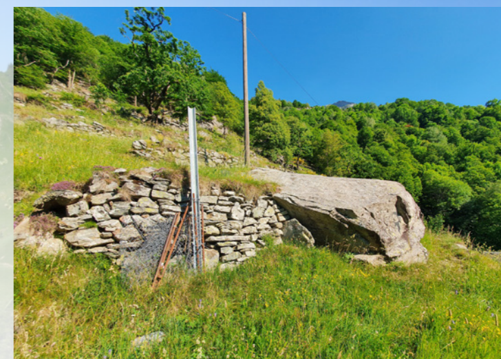
Souvent, la construction des murs à sec était adaptée en fonction des blocs présents sur le terrain.

La partie inférieure des terrasses est encore exploitée comme prairies de fauche, tandis que la partie supérieure est pâturée et partiellement envahie par des arbres. Les bâtiments concentrés sur le côté sud-ouest, près du sentier muletier qui mène de Brontallo vers les sommets et aux alpages, sont en partie disposés en escaliers. Près des bâtiments, il y a aussi une ancienne chapelle votive. Cachés sous les blocs les plus imposants ou intégrés dans les murs, on trouve parmi les terrasses des «splüi» (refuges naturels sous la roche) de dimensions très variables.