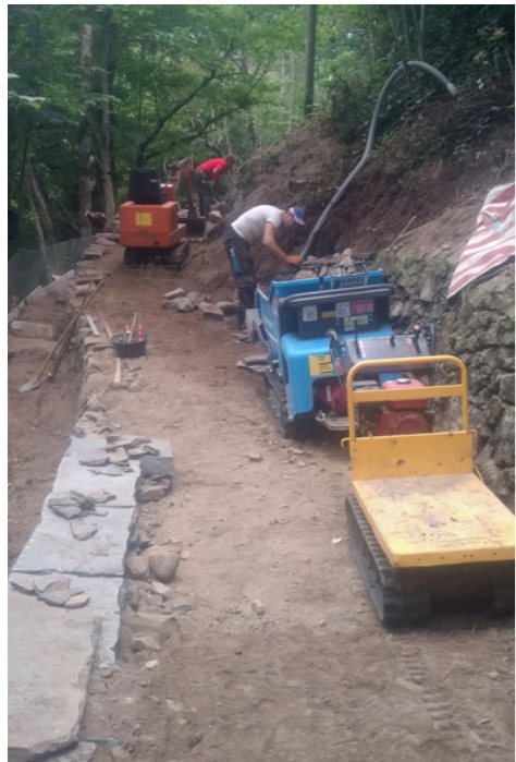
Reconstruction des murs en pierres sèches au bord du sentier

Il est prévu pour ces raisons de remettre en état ou de remplacer selon des méthodes artisanales les murs longeant le chemin avec des pierres d'origine ou disponibles sur place.