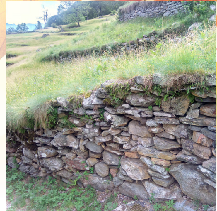
Murs de pierres sèches dans la partie basse de Scinghiöra

Les objectifs du projet sont la mise en sécurité du chemin et la valorisation d'un tronçon important pour le paysage.