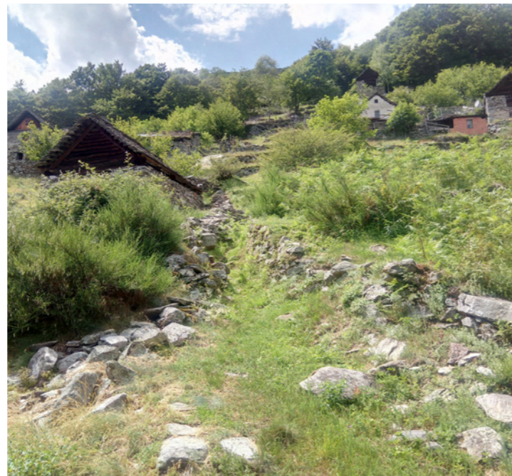
«Carraa» (chemins entre deux murs de pierres sèches)

Scinghiöra est situé sur la voie d'accès agricole qui mène aux alpages de Menzonio et de Brontallo. La zone est reliée aux deux villages par deux chemins distincts. L'accès depuis Brontallo est actuellement possible sans difficulté, mais le chemin de Menzonio à Scinghiöra est en très mauvais état.