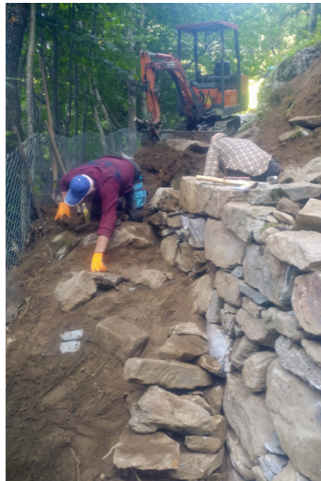
Reconstruction des murs de soutènement