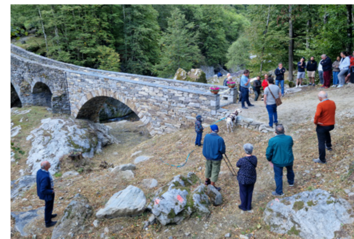
Cérémonie d'ouverture du pont

Nous avons sécurisé tout le chemin qui part de Menzonio et mène à Schinghiöra. Ce chemin, autrefois utilisé pour la transhumance, est très escarpé et a de nombreux tronçons en marches en pierre. L'objec-