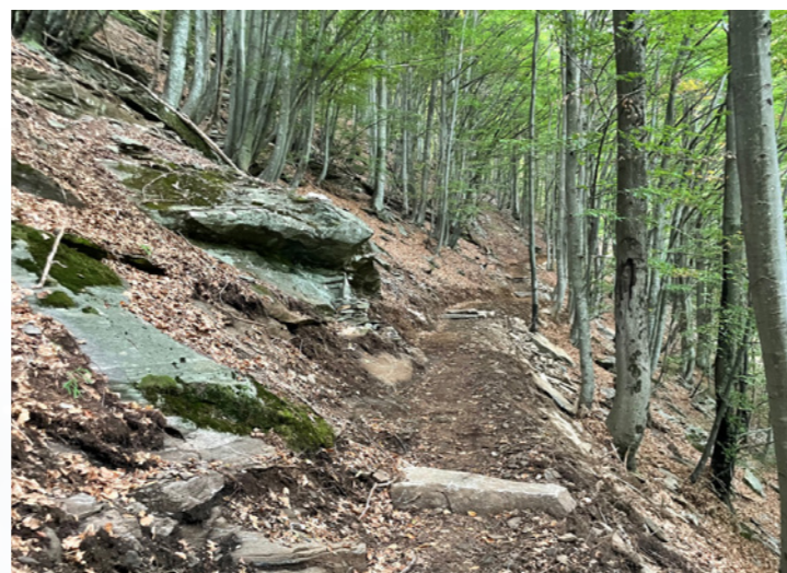
Sentier du Val Serenello

Pour notre association, il est important de réaliser des travaux d'entretien du territoire pour préserver le travail accompli. C'est une partie importante de notre activité qui nous prend beaucoup de temps, surtout au printemps et en été.