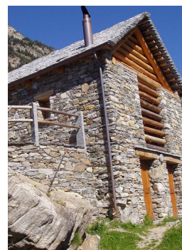
Agriturismo 1 (Scinghiöra)