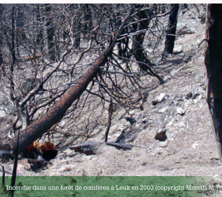
Incendie dans une forêt de conifères à Leuk en 2003