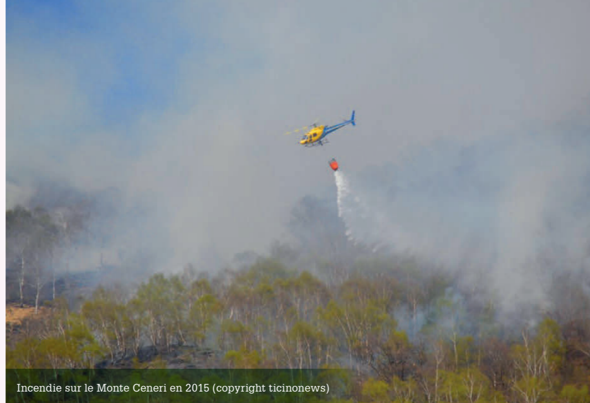
Incendie sur le Monte Ceneri en 2015

On peut également se demander, à juste titre, quelles sont les consé-