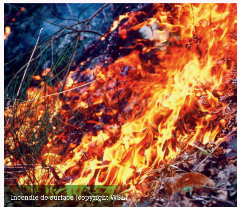
Incendie de surface

général très rapidement sur les pentes raides. Il consomme la matière organique sèche présente au sol et calcine les troncs des arbres qui meurent souvent ensuite (la température à quelques centimètres du sol peut atteindre 600 °C). Durant la période de sécheresse hivernale, la cause des incendies est