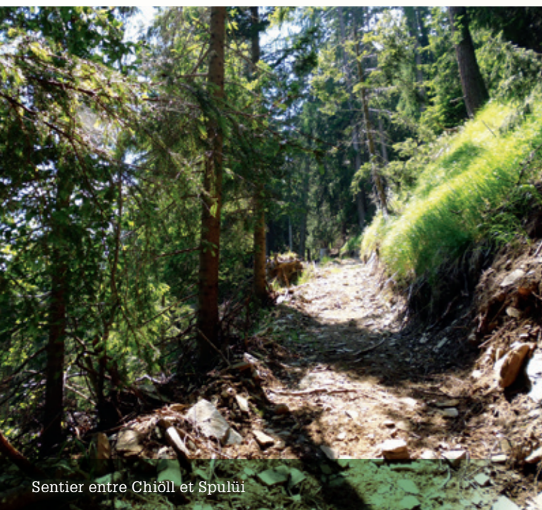
Sentier entre Chiöll et Spulüi

à construire l'an dernier env. 1,3 km des 2 km prévus. Ils nous ont permis d'arriver quand même jusqu'à «Velt», le premier niveau de l'alpage.