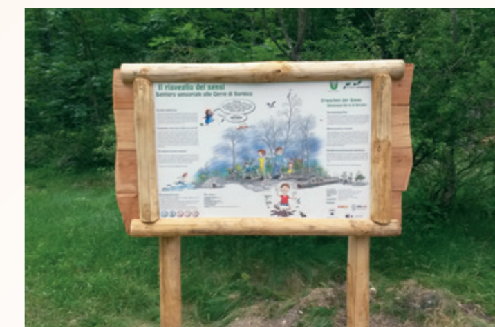
Le panneau d'information à l'entrée du sentier

La municipalité de Lavizzara a donc décidé de promouvoir la création d'un sentier sensoriel dans la localité de Gerre de Sornico, qui vient enrichir l'offre de loisirs dans la commune. C'est une première au niveau cantonal. La commune bourgeoise de Sornico, propriétaire du fonds sur lequel serpente le sentier d'environ 500 m de long, a adhéré au projet avec enthousiasme. Le sentier a été créé dans une forêt alluviale fascinante, sur le bord d'un bras de la rivière Maggia, dans un splendide