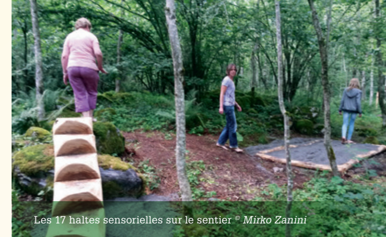
Les 17 haltes sensorielles sur le sentier

environnement naturel qui offre une multiplicité de stimulations sensoriels. Le sentier permet d'amener le visiteur à faire l'expérience de sensations tactiles variées et évocatrices, comme marcher sur de la mousse, dans la boue, sur des pignes, dans le ruisseau, dans le sable, sur des cailloux et des écorces de châtaignier, etc. Le sentier compte aussi une bonne quinzaine de haltes pour entraîner son sens de l'équilibre, par exemple en marchant sur une planche à bascule et perché sur des échasses en bois. On peut, bien évidemment, se laver les pieds à la fin du parcours.