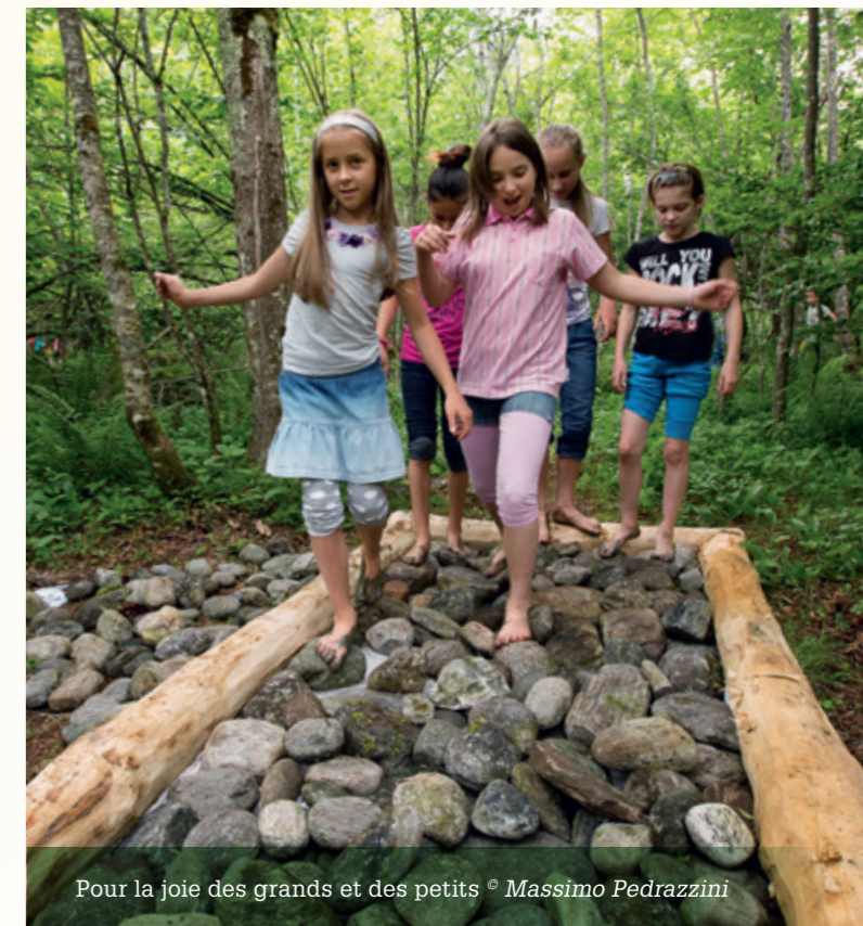
Pour la joie des grands et des petits

environnement naturel qui offre une multiplicité de stimulations sensoriels. Le sentier permet d'amener le visiteur à faire l'expérience de sensations tactiles variées et évocatrices, comme marcher sur de la mousse, dans la boue, sur des pignes, dans le ruisseau, dans le sable, sur des cailloux et des écorces de châtaignier, etc. Le sentier compte aussi une bonne quinzaine de haltes pour entraîner son sens de l'équilibre, par exemple en marchant sur une planche à bascule et perché sur des échasses en bois. On peut, bien évidemment, se laver les pieds à la fin du parcours.