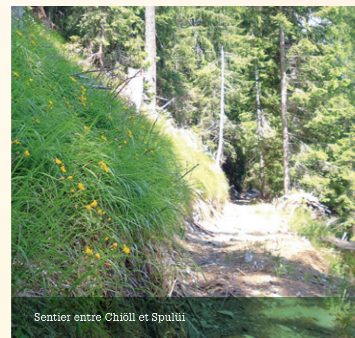
Sentier entre Chiöll et Spulüi

Nous envisageons de terminer les travaux d'ici fin octobre, lorsque nous atteindrons «Spulüi». Nous espérons que la météo sera plus favorable cette année que l'an passé, afin que nous puissions atteindre nos objectifs et terminer ces travaux nécessaires pour une meilleure exploitation de l'alpage.