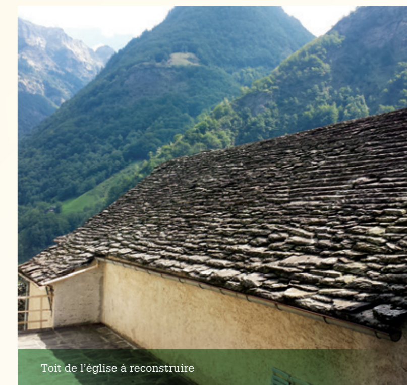
Toit de l'église à reconstruire

Pour les habitants de Brontallo, elle a toujours été un lieu de recueillement et de rencontre, mais pas seulement. En fait, l'église a un long passé historique, riche de traditions, et il se raconte qu'en certaines circonstances, les habitants de Brontallo, en période de glissements de terrain et d'avalanches, apportaient pour quelque temps les berceaux avec les nouveau-nés dans l'église considérée comme un lieu plus sûr.