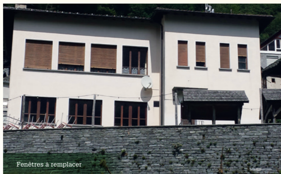
Fenêtres à remplacer

Considérant que l'immeuble a maintenant près de 60 ans, la commune bourgeoise a décidé qu'il était temps d'effectuer certains travaux qui permettront de continuer à garantir sa fonctionnalité et à améliorer son efficacité énergétique. Après l'installation du chantier, les démolitions nécessaires, la construction d'éventuelles