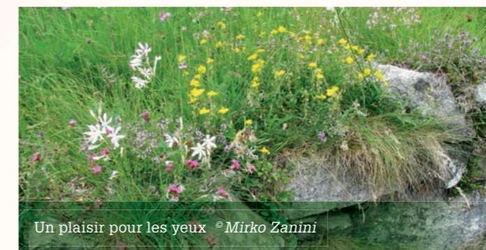
Un plaisir pour les yeux