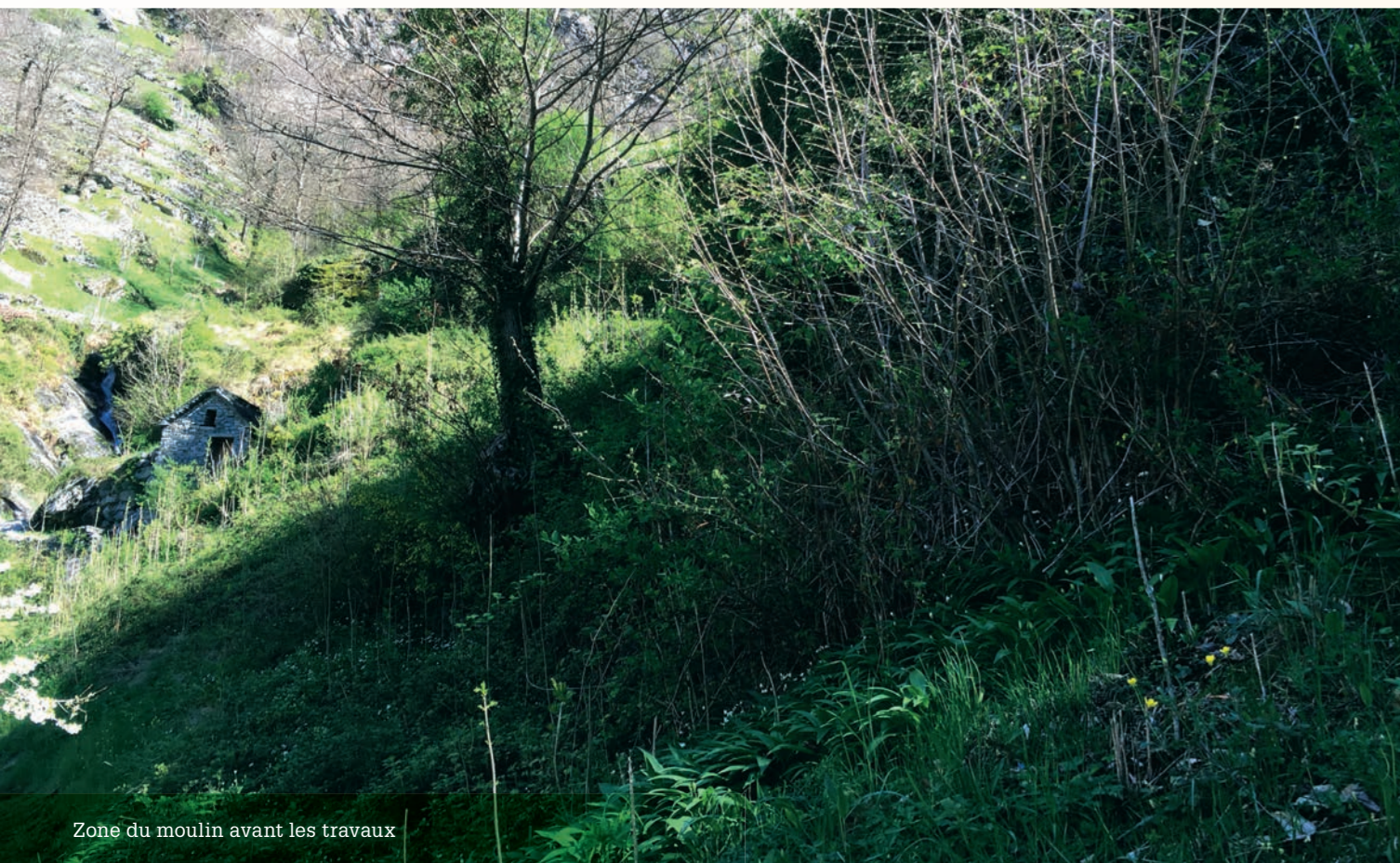
Zone du moulin avant les travaux

L'objectif principal de ce programme quadriennal est la gestion du territoire rural de Brontallo en étroite collaboration avec les agriculteurs locaux, en particulier, la gestion des surfaces agricoles récupérées ou réalisées dans le cadre du projet pilote et dans celui du programme de gestion du paysage démarré en 2007.