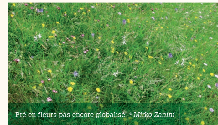
Pré en fleurs pas encore globalisé

Les espèces exotiques (néophytes) constituent certainement des menaces qui contribuent de manière significative à la réduction de la diversité floristique des prés. La globalisation croissante implique une augmentation du commerce, des transports et des voyages et entraîne une homogénéisation sans précédent de la biodiversité provoquée par l'introduction (involontaire ou volontaire) et l'implantation successive d'espèces en dehors de leur aire