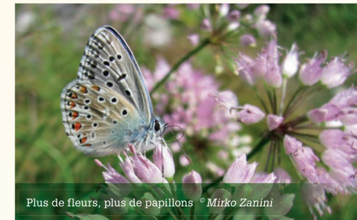
Plus de fleurs, plus de papillons

de répartition naturelle. Mais heureusement pas toutes les plantes néophytes sont invasives. Les espèces exotiques peuvent, cependant, causer des dommages à l'écologie, à la santé et à l'économie, c'est pourquoi il existe des programmes de gestion pour les éradiquer ou limiter leur expansion. Selon un rapport spécial publié par l'OFEV, plus de 800 espèces exotiques sont présentes en Suisse dont une centaine est devenue invasive. Le site Infoflora ( www.infoflora.ch ) fournit des informations utiles sur ces espèces problématiques aux professionnels, mais aussi à tous les amoureux de la nature qui s'y intéressent.