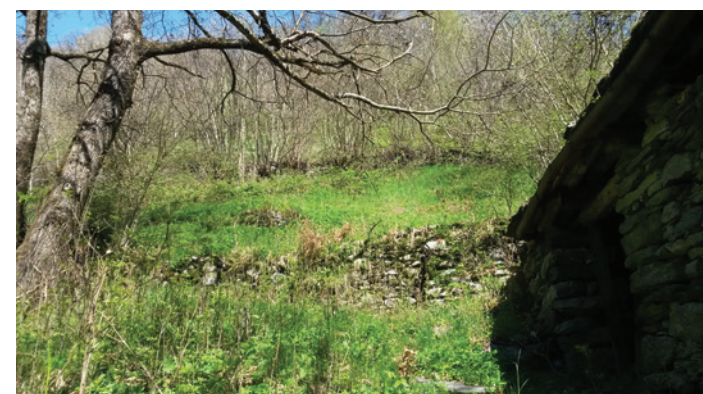
Jeunes plantées à couper pour réhabiliter le bois

Dans le cadre de ce projet aussi, les interventions prévues sont nombreuses et nous espérons être en mesure d'effectuer les premiers travaux de taille de la végétation cet automne et, si la météo le permet, de commencer ensuite la reconstruction des murs de pierres sèches qu'ils sont déjà tombés ou qu'ils se trouvent en conditions précaires.