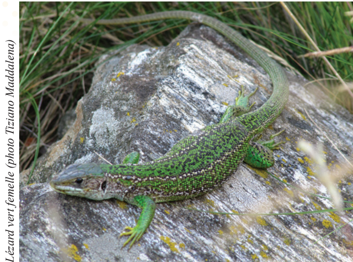
Lézard vert femelle

En marchant sur les chemins de Brontallo, il n'est pas rare d'être surpris par des bruissements soudains dans les feuilles. Le regard est immédiatement attiré par l'auteur de ces bruits: le lézard vert ( Lacerta bilineata ), l'émeraude du Tessin. Cette grande espèce de lézard est absolument inoffensive et présente en Suisse uniquement dans les régions chaudes: le Tessin, le Valais, les vallées méridionales des Grisons, Genève et le Chablais vaudois.