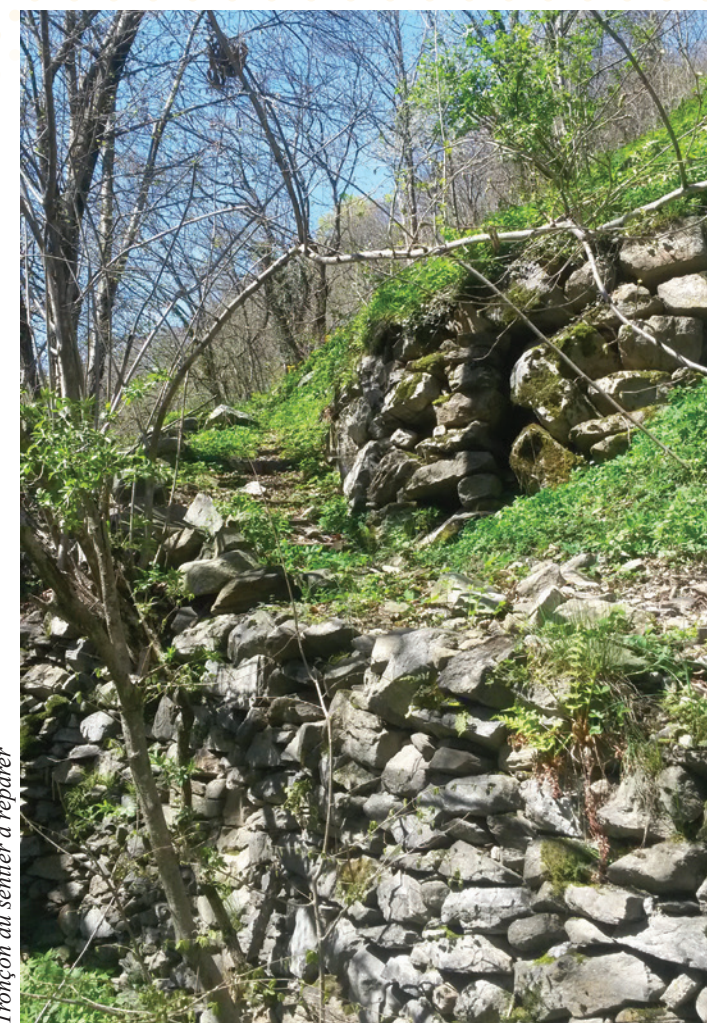
Tronçon du sentier à réparer

Ces dernières années, notre association s'est efforcée de réhabiliter divers terrains pour en faire des prés pour le fauchage ou seulement des pâturages afin d'aider les agriculteurs de notre région qui travaillent dans des conditions particulièrement difficiles.