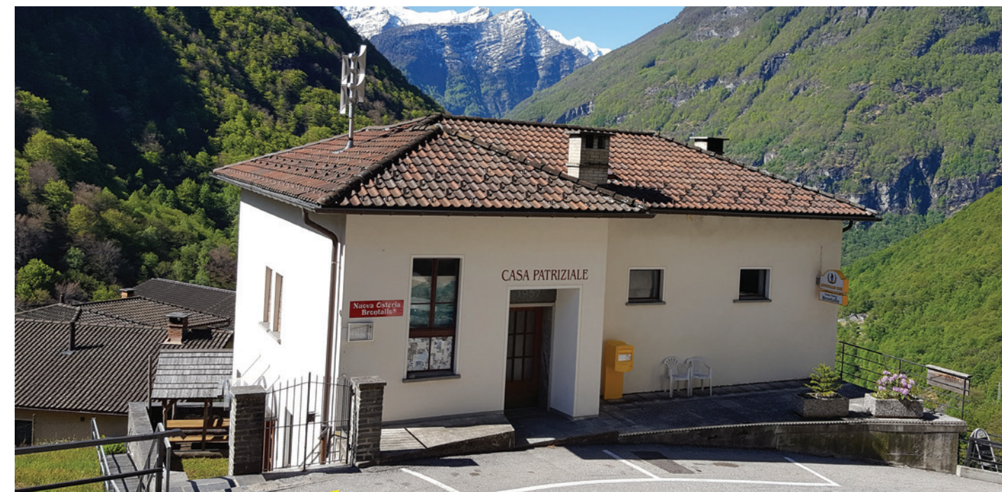
La maison bourgeoisiale

Nous envisageons ensuite d'éventuellement démolir des murs et d'en reconstruire des nouveaux pour créer de nouvelles ouvertures, de remplacer toute l'installation sanitaire ainsi que les radiateurs électriques actuels et d'installer une pompe à chaleur pour le chauffage central et la production d'eau chaude sanitaire.