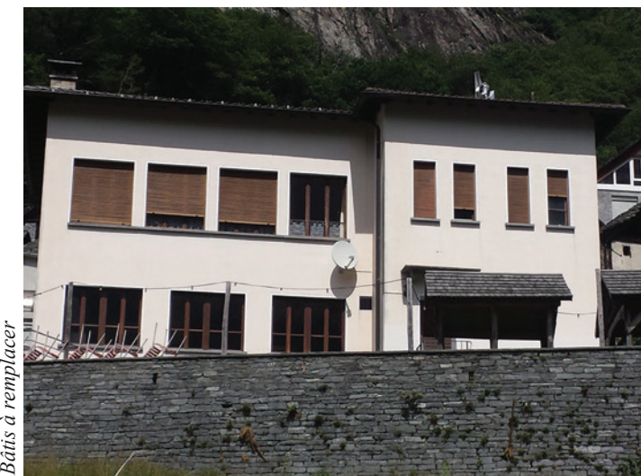
Bâti à remplacer

Après le regroupement des communes du val Lavizzara en 2004 et compte tenu de la grande importance du bâtiment, la bourgeoisie de Brontallo a demandé à la commune de l'acheter et en est maintenant propriétaire.