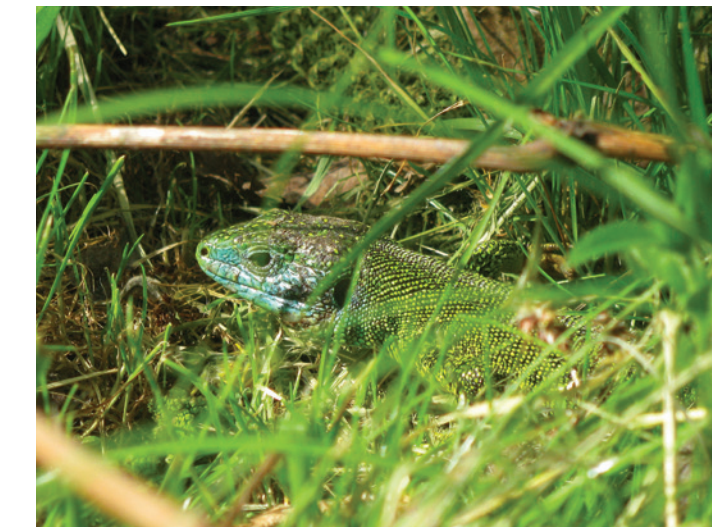
Lézard vert mâle