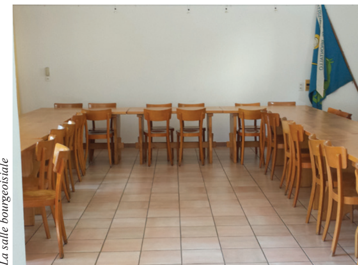
La salle bourgeoisiale

Ces dernières années, on a effectué des travaux, essentiellement au rez-de-chaussée qui héberge le restaurant. Nous avons, en particulier, fait déplacer l'entrée pour permettre aussi aux personnes handicapées d'accéder au restaurant par une rampe.