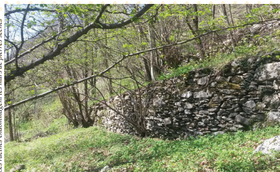
Les racines endommagent les murs de pierres sèches