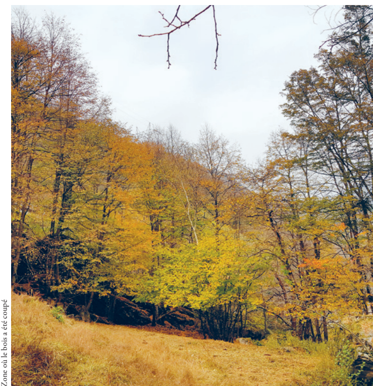
Zone où le bois a été coupé