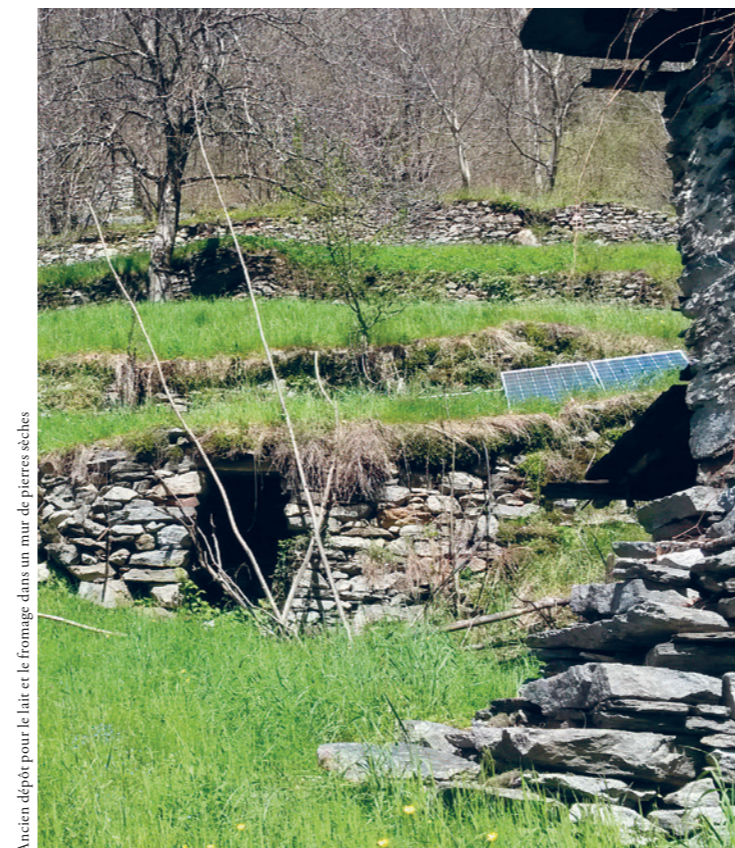
Ancien dépôt pour le lait et le fromage dans un mur de pierres sèches

Dans une terrasse située au-dessus de la fontaine il se trouve une niche qui servait probablement autrefois pour le dépôt intermédiaire du lait et du fromage. Elle est relativement en bon état, de sorte que seuls les murs de soutien nécessitent des travaux de rénovation.