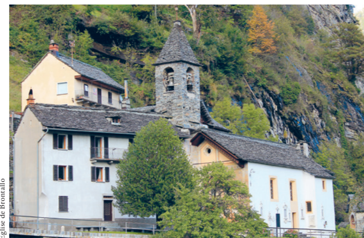
Eglise de Brontallo

Recevez ici encore nos excuses pour notre manque; nous vous tiendrons au courant dès que nous aurons de nouvelles informations sur l'avancement du projet.