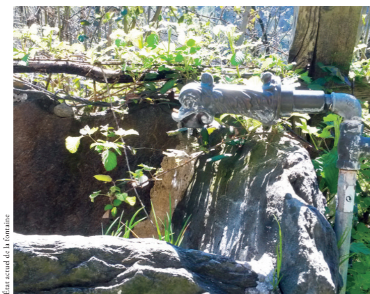
État actuel de la fontaine

Le comble du toit de cet stable doit être reconstruit, afin d'éviter la détérioration irréversible de la charpenterie. De plus, une ancienne fontaine en gneiss naturel doit être restaurée. Les joints intérieurs doivent être étanchéifiés et la végétation éliminée.