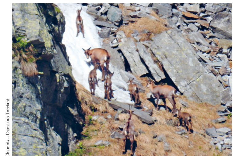
Chamois - Damiano Tortini

Depuis la fin des années 1990, le nombre de chamois diminue hélas en Suisse et dans d'autres pays alpins. Un cinquième de la population (soit environ 90 000 bêtes) vit en Suisse; par conséquent, une responsabilité particulière pour ces animaux incombe à notre pays. Afin de mettre plus précisément en évidence les raisons de ce recul inquiétant, la Conférence des services de la faune, de la chasse et de la pêche (CSF), ChasseSuisse et l'Office fédéral de l'environnement (OFEV) ont organisé un congrès en 2015. Les experts présents ont constaté une série de raisons qui exercent une pression sur cette espèce particulièrement d'ongulés. « Réduction des milieux naturels sous l'effet de l'estivage intensif et des activités de loisirs, en particulier en hiver manque de calme dans les espaces de retrait, déséquilibre de la structure sociale et d'âge suite à planification insuffisante et à une mauvaise pratique de la chasse, retour des grands prédateurs, maladies, concurrence du cerf et du bouquetin. La pression exercée par la chasse est également un facteur important. »