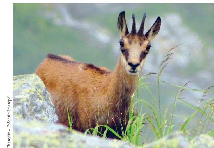
Chamois - Frédéric Imstieph

animaux d'âge moyen – tant femelles que mâles – constituent le socle d'une population. Ils transmettent des traditions, exercent une influence apaisante durant la période de rut et veillent à une meilleure réussite de la reproduction. Parmi les populations chassées, la pression de la chasse est souvent un facteur décisif quant à l'évolution démographique de l'espèce. Si l'on entend maintenir la chasse, une gestion durable de celle-ci sur la base de critères scientifiques est indispensable. Il importe en particulier de ne pas mettre en péril les animaux d'âge moyen (entre cinq et dix ans) afin de préserver les populations chassées. Dans de nombreuses régions, les boucs d'âge moyen sont indubitablement victimes d'une chasse excessive.