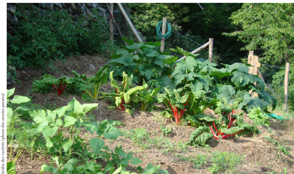
Jardin des variétés (photo des années passées)

Il ne nous reste plus qu'à les remercier et à leur souhaiter bonne chance!