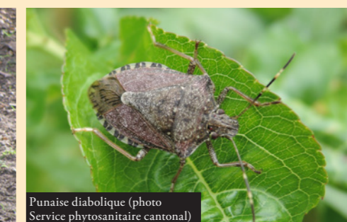
Punaise diabolique