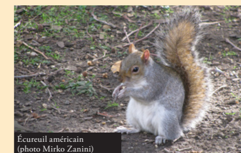
Écureuil américain

Qui pourrait penser qu'une grave menace pèse sur le gentil écureuil roux ( Sciurus vulgaris ), habitant typique de nos forêts? Depuis les années 60, une espèce d'écureuil d'origine américaine, l'écureuil gris ( Sciurus carolinensis ), a malheureusement été introduite en Italie. L'expérience du Royaume-Uni montre que l'arrivée de cette espèce allogène entraîne la disparition de l'espèce indigène moins compétitive. La progression de cette espèce observée durant ces décennies en Italie indique que les premiers individus sont aussi arrivés au Tessin en 2017. Le combat semble difficile, mais l'écureuil indigène roux mérite que l'on se penche sérieusement sur le problème.