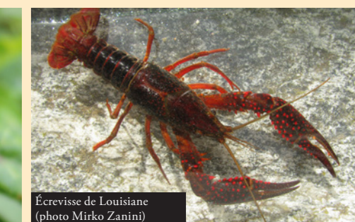
Écrevisse de Louisiane