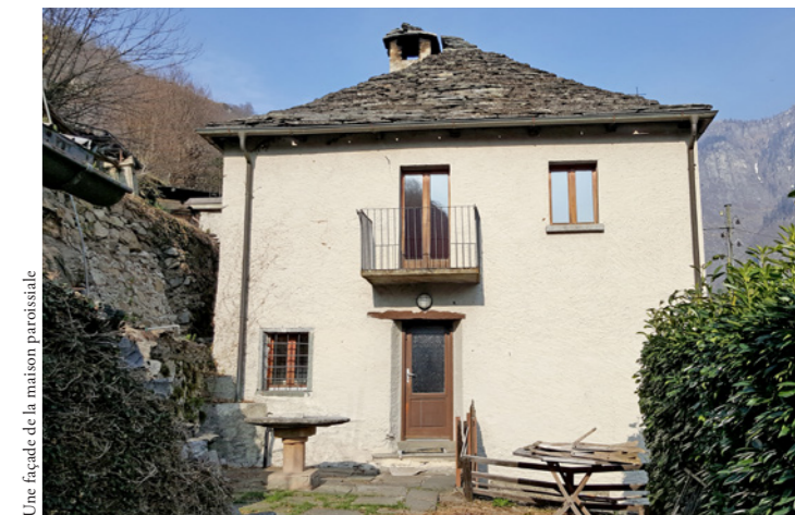
Une façade de la maison paroissiale

On a constaté ces dernières années que de plus en plus de personnes veulent quitter la ville et aller s'installer dans des secteurs plus périphériques. Brontallo et Menzonio sont un peu plus éloignés, mais la ville est facilement accessible. Pour ces raisons, nous avons bon espoir que le projet de Menzonio parvienne au même résultat qu'à Brontallo.