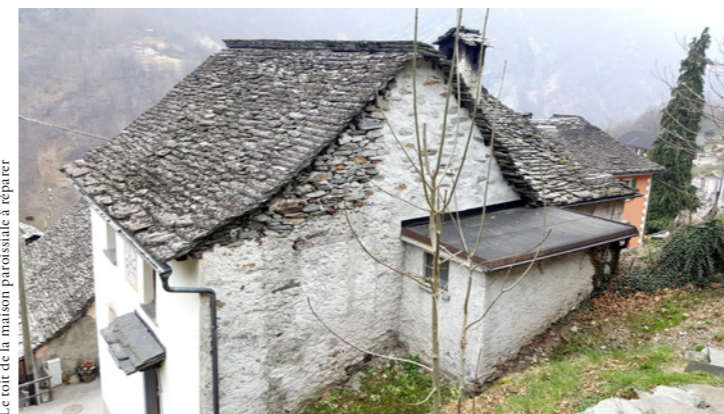
Le toit de la maison paroissiale à réparer

Actuellement, le bâtiment est en relativement bon état. Il a seulement besoin de quelques travaux d'entretien et d'un bon coup de peinture. Les principaux travaux seront effectués à l'intérieur et le toit en dalles de pierres devra être refait. Il est prévu d'installer au rez-de-chaussée une entrée secondaire, un local technique, une buanderie et une cave. L'entrée principale sera située au premier étage avec un appartement composé d'une cuisine, d'une salle à manger, d'un séjour avec cheminée, d'une chambre, d'un bureau et d'une salle de bains avec douche. L'appartement du deuxième étage prévoit une entrée, une cuisine, une salle à manger, un séjour avec cheminée, une chambre et une salle de bains avec douche.