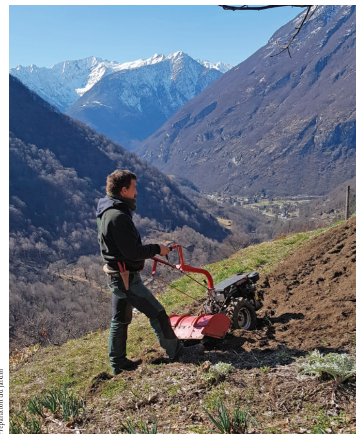
Préparation du jardin