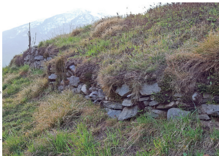
Murs en pierres sèches endommagés à reconstruire

On en a recensé environ 28 km. Malheureusement, avec