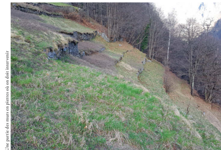
Une partie des murs en pierres sèches ou doit intervenir

coles encore exploitées. Les murs ont ainsi retrouvé leur utilité en créant des surfaces relativement planes pour faciliter le fauchage. Comme notre territoire est particulièrement escarpé la construction de murs de pierres sèches a permis de résoudre, au moins en partie, le problème de l'irrigation permettant à l'eau de rester sur les terrasses, ce qui n'est pas possible sur les terrains à forte pente. Là où nous avons procédé aux travaux, nous avons également essayé de créer de petites rampes d'accès permettant le passage d'une petite faucheuse entre les terrasses.