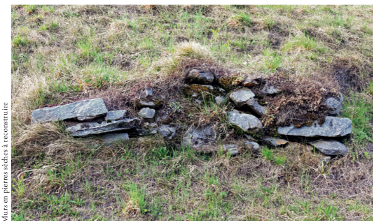
Murs en pierres sèches à reconstruire

Vu leur grand nombre sur notre territoire, nous avons déjà démarré, il y a plusieurs années, un programme de reconstruction qui nous a permis de refaire plusieurs mètres de murs de pierres sèches, en particulier dans les zones agri-