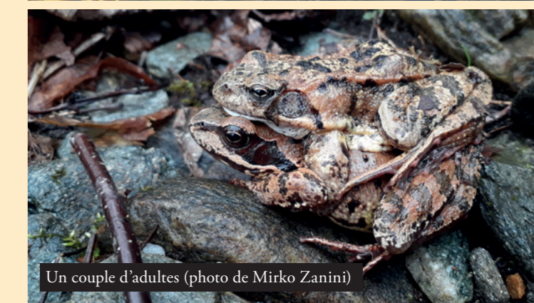
Un couple d'adultes