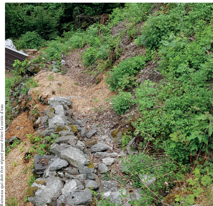
Ruisseau qui doit être réparé pour éviter la sortie d'eau

Maintenant, nous devons nous concentrer sur la zone au nord, près de la route cantonale. À cet endroit, il est nécessaire de stabiliser le terrain et de prévoir de canaliser un petit ruisseau qui crée des problèmes, surtout en cas de fortes pluies, lorsque l'eau sort de son cours.