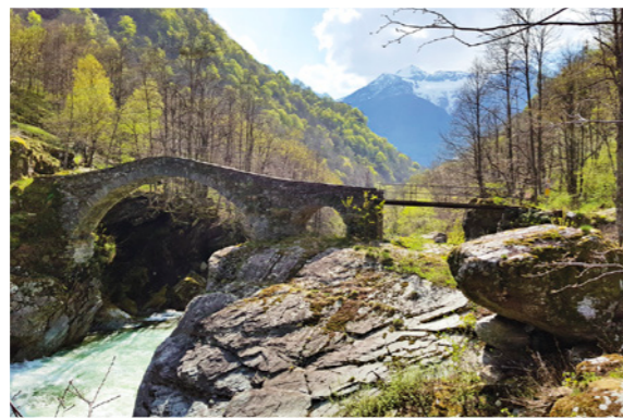
«Ponte della Merla»

All das war und ist nur mit Ihrer wertvollen Unterstützung möglich. Dafür danken wir Ihnen von ganzem Herzen!