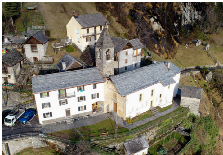
Das Kirchendach ist fertiggestellt

Dank Ihrer grosszügigen Unterstützung konnten die Dächer der Pfarrkirche und des Pfarrhauses neu gedeckt werden. Dafür möchten wir uns auch im Namen der Pfarrgemeinde Brontallo ganz herzlich bedanken.