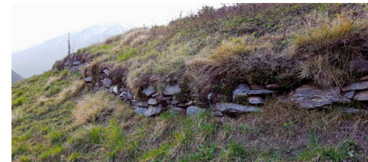
Trockenmauern im Bereich Coste

Dazu gehört der Wiederaufbau der Trockenmauern rund um Coste . Das betroffene Gebiet liegt gleich hinter dem Friedhof von Brontallo. Man erreicht es zu Fuss nach etwa 10 Minuten auf dem Saumpfad, der nach Menzonio führt. Es handelt sich um eine Fläche von rund 2'300 m 2 .