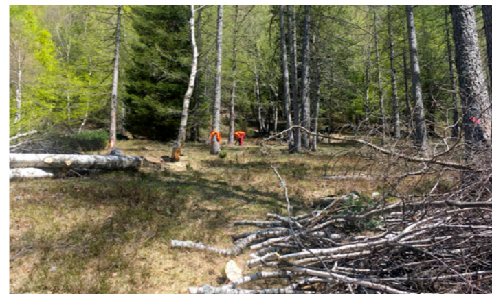
Aufforstungsarbeiten im Val Serenello

Die Waldweiden befinden sich auf einer Höhe von ca. 1'300 Meter über Meer und erstrecken sich über eine Fläche von rund 5 Hektar. Teilbereiche dieses Gebiets konnten nicht ausreichend als Weideland genutzt werden, da in den letzten Jahren viel Jungwald nachgewachsen ist. Diese junge Vegetation haben wir entfernt.