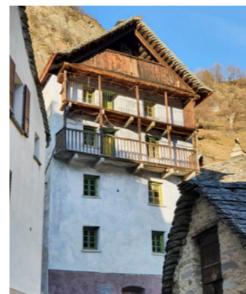
Abgeschlossene Arbeiten an Ca' di Giörgia

Inzwischen wurden bereits die Deckenplatten eingezogen und die Innenwände aufgestellt. Jetzt muss das Dach neu gedeckt und die Haustechnik installiert werden. Dann werden die Wände verputzt und die Bodenbeläge verlegt. Im Laufe des Sommers sollten dann alle Arbeiten abgeschlossen sein.