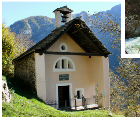
Oratorium von Mogneo